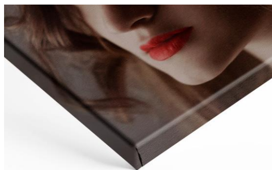
4 cm Keilrahmen